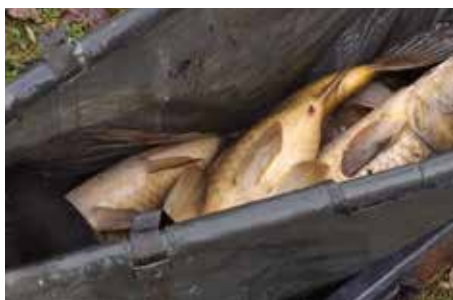
FV Knittelfeld: Sorgsam befördert, fanden auch kapitale Karpfen ein neues Zuhause.

mals bei allen Mitgliedern für die Mithilfe und die im Jahr 2022 geleistete Arbeiten bedanken, egal ob in der Rachau, bei der Fischzucht, den Fischlieferungen oder dergleichen.