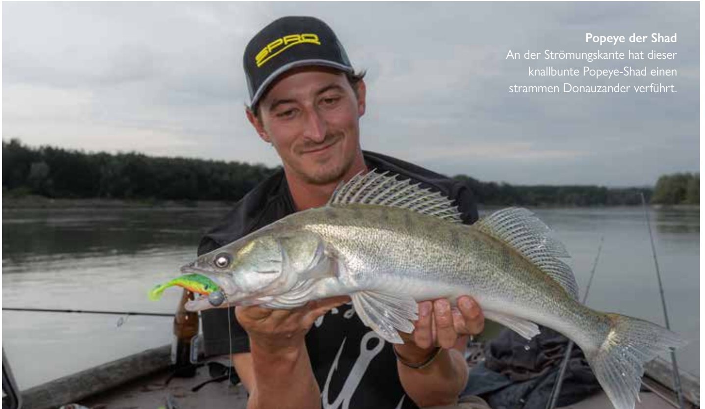
Popeye der Shad An der Strömungskante hat dieser knallbunte Popeye-Shad einen strammen Donauzander verführt.