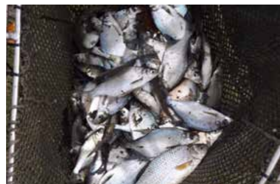
Auch viele Kleinfische wurden aus dem Authaler Teich „umgesiedelt“.

Der Herbstbesatz in der Mitterau stellte uns 2022 vor einige Herausforderungen, denn die Qualität und Menge der geforderten Besatzfische ist von Jahr zu Jahr schwieriger zu bekommen (von den jährlichen Preissteigerungen ganz zu schweigen). Umso wichtiger ist es, dass nicht jeder große Hecht oder Zander entnommen werden muss, und wie wir heuer anhand der Fangberichte und Bilder ge-