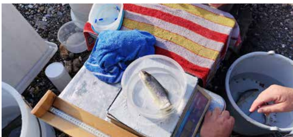
AFV Fuscher Ache: Nach dem Wiegen und Vermessen wurden die Fische wieder unbeschadet rückversetzt.

Monitoring-Ergebnisse einer gut funktionierenden Fischaufstiegshilfe gibt es an der Fuscher Ache nur wenige. Solche Bestandserhebungen liefern aber im besten Fall wertvolle Zusatzinformationen über ihre Qualität als Lebensraum, die Funktionsfähigkeit kann allerdings damit nicht beurteilt werden, zumal nicht einmal unterschieden werden kann, ob Fische eingewandert sind, oder aus dem Oberwasser „verspült“ worden sind. Also der Begriff „Monitoring“ wird in vielen Zusammenhängen genutzt und bedeutet übersetzt „Beobachtung“. Gemeint ist damit stets eine Überwachung bzw. kontinuierliche Beobachtung.