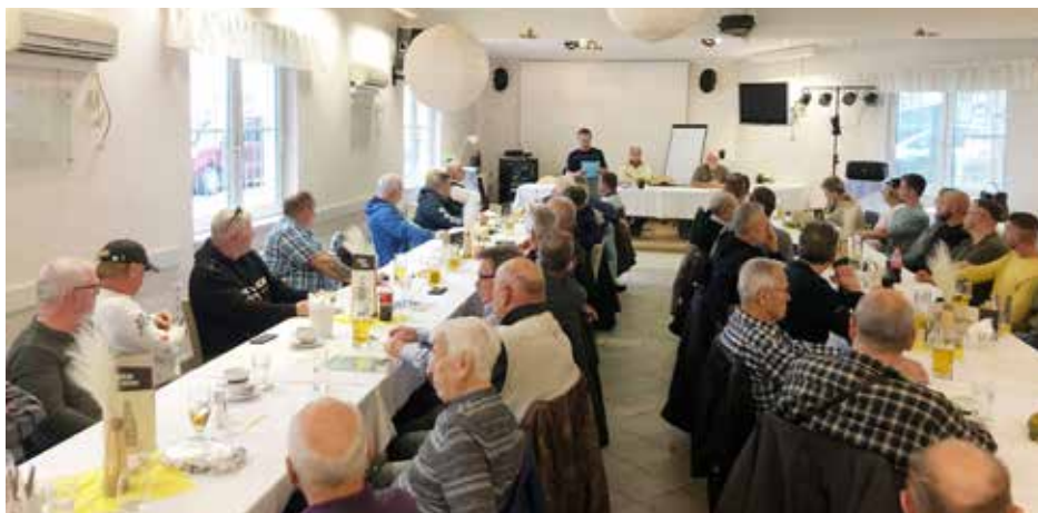
Großes Interesse seitens der Vereinsmitglieder bei der Jahreshauptversammlung 2022 des FV Schillerwasser im November.

Hintergrund des Verbotes: Wenn eine Störung bei den Turbinen auftritt, oder durch einen Netzausfall die Turbine stillgesetzt wird, werden automatisch die Wehrfelder geöffnet und das Wasser fließt über diese Wehrfelder ungehindert ab. Da dieser Vorgang mit großer Geschwindigkeit passiert, ist das rechtzeitige Verlassen der Schotterbank nicht möglich und mit unmittelbarer Lebensgefahr verbunden.