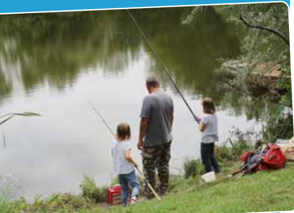
Zwei Jungfischerinnen beim Schnupperfischen an der Schwachat bei spiegelglattem Wasser.