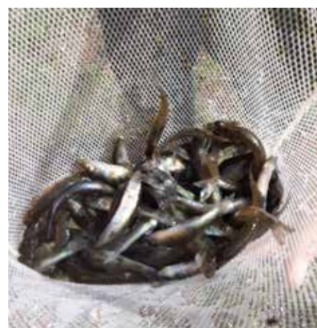
Jungzanderbesatz Breiteicher Teich.

Tagesordnung: 1. Eröffnung und Begrüßung; 2. Totengedenken; 3. Wahl der Wahlkommission 4. Berichte: a) Obmann-Stv., b) Kassier, c) Kassenkontrolle, d) Fischereikontrolle und Gewässerwart, e) Verbandsbericht; 5. Neuwahl; 6. Anträge; 7. Allfälliges (anschließend Lizenzausgabe 2023).