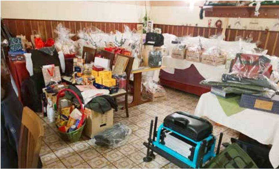
Unsere verlostene Sachpreise bei der Weihnachtsfeier am 26. November.

Deutsch Wagram, zu unserer Weihnachtsfeier treffen. Über 90 Mitglieder mit Partnerinnen verbrachten einen schönen Abend. Das Essen bezahlte – wie gehabt – unser Verein. Das Highlight ist wie immer die sehr beliebte Tombola, bei der es tolle Preise von Angelsachen bis zu üppigen Geschenkskörben gab.