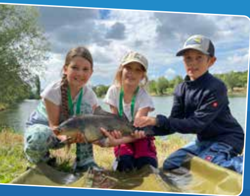
Die Nachwuchs-AnglerInnen konnten dem Tullner Teich einen Karpfen entlocken.