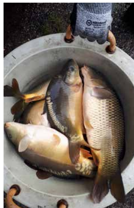
Herbst-Karpfenbesatz Fürholz-Teich.

Die Generalversammlung mit Lizenzvergabe des Fischereiverein Wolfsthal findet am Freitag, dem 06. Jänner 2023, um 15 Uhr im Hotel Kurtschack in Wolfsthal (Sportplatzweg 11) statt.