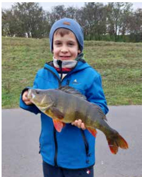
Floridsdorf: Ein kapitaler Barsch aus der Neuen Donau..