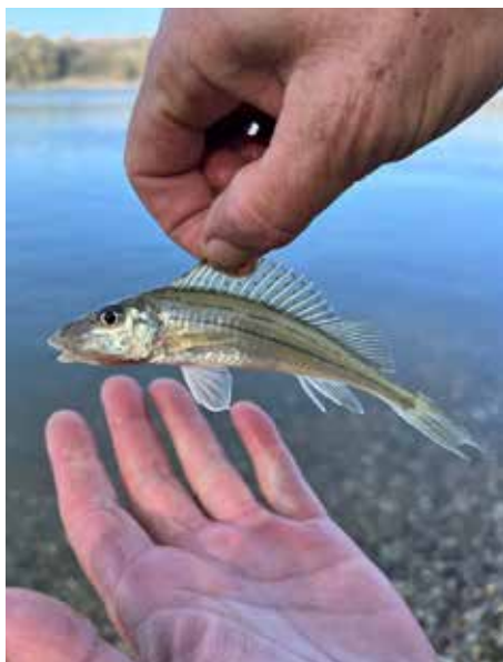
Auch unser Schriftführer fängt Fische – ein wunderschöner Schrätzer aus der Donau Haslau.

Tel. 0 660/731 19 46, oder per E-Mail: office@fv-haslau-mariaellend.at