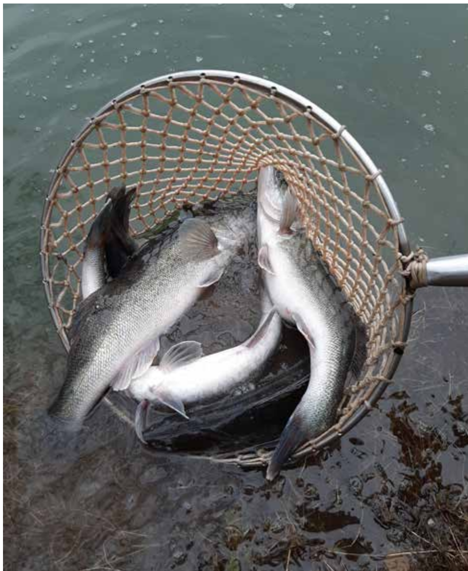
Zanderbesatz Breiteicher Teich.

ausreichend Freizeit. Der knapp eintägige Kurs des VÖAFV-Kontrollreferates wird dann voraussichtlich im Februar des Jahres 2023 stattfinden. Bei Bedarf erfolgt der Einsatz der neuen ehrenamtlichen Kontrollorgane bereits ab 1. Oktober 2023.