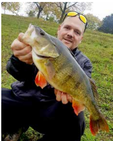
Ebenso ein schöner Barsch aus dem Revier Floridsdorf.

Lokal, 1210 Wien, an folgenden Terminen statt (abhängig von der aktuellen Covid-19-Pandemieverordnung): Samstag, 7. Jänner 2023, von 17–20 Uhr, Sonntag, 22. Jänner 2023, von 9–12 Uhr (nach der Jahreshauptversammlung), Sonntag, 5. Februar 2023, von 9–12 Uhr, Sonntag, 26. Februar 2023, von 9–12 Uhr.