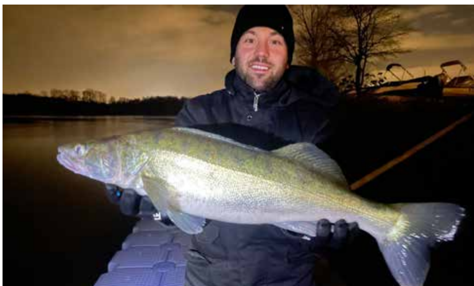
Ein kapitaler Zander, gefangen im Kuchelauer Hafen. Wir gratulieren dem Fänger recht herzlich.