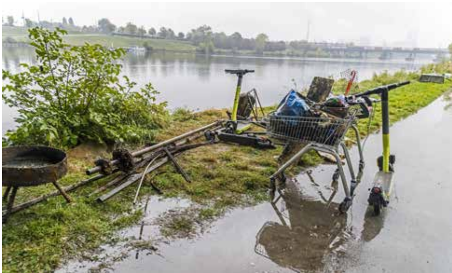
Teilergebnis der Gewässerreinigung in Floridsdorf in Kooperation mit Tauchern ...

Die abgelaufene Lizenz, Mitgliedsbuch, gültige Fischerkarte für Wien und ausgefüllte Fangstatistik unbedingt mitnehmen. Neumitglieder müssen bitte ein Passfoto und die amtliche Fischerkarte mitbringen! Wir freuen uns über viele alte und neue Gesichter. Jungfischer aufgepasst! Wenn du dir deine