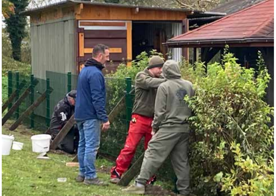
Die Zeit, wo die Fischerhütte in Krummnussbaum von einem von Wind und Hochwasser zerfressenen Holzzaun umrandet war, ist endlich vorbei!

Diese Tage sollen dazu dienen, dass ihr dem Vorstand eure Anliegen und Wünsche