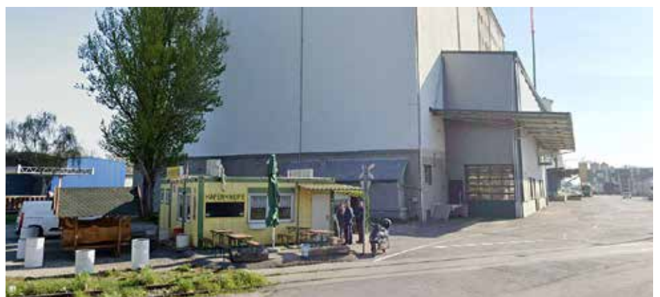
Die „Hafenkneipe“ in Albern.

Das Schloss beim Schranken ist immer zu versperren. Bei Missachtung droht der Verlust der Einfahrtsgenehmigung! Ist der Treppelweg im Winterhafen frei, so muss auch vom Treppelweg aus geangelt werden. Wir ersuchen alle Lizenznehmer, die Angelplätze sauber zu halten und mitgebrachte Abfälle wieder mitzunehmen.