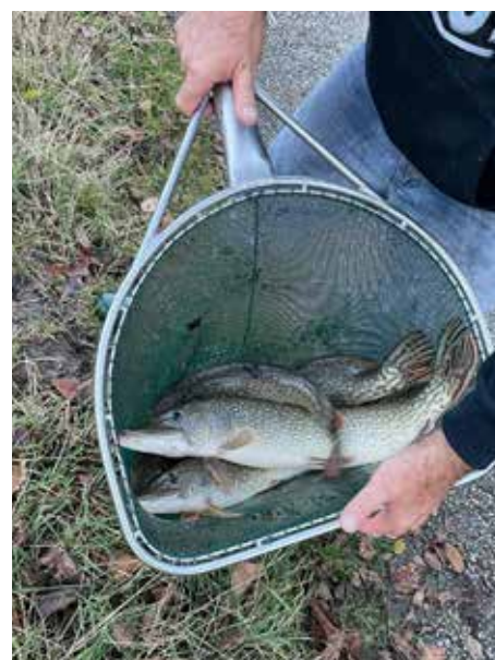
Hechtbesatz des FV Schwechat 71.

heim Rannersdorf, Reinhartsdorf-gasse 13a. Um rege Teilnahme wird gebeten! Das Angeln ist während der Reinigung ausnahmslos verboten!