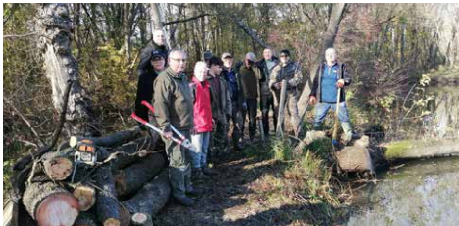
Fleißige Helfer bei der Revierreinigung im November 2022.