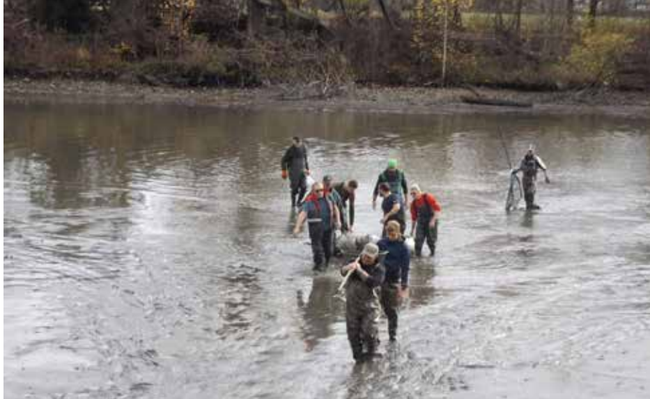
FV Knittelfeld: Abfischen des Authaler Teiches: Danke an die vielen Helfer!