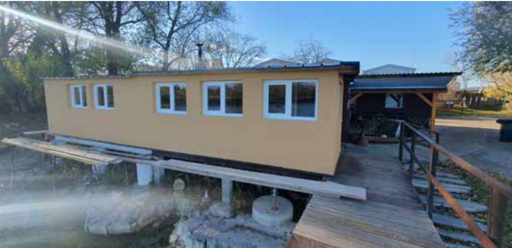
Die neue Fassade der Vereinshütte des FV Oeynhausen.

fischbesatz mit Zander, sowie im kleinen Teich mit Hecht und Wels besetzt.