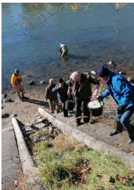
Tatkräftiger Einsatz der Salzburger Fischer beim Herbstbesatz von Regenbogenforellen in die Salzach.