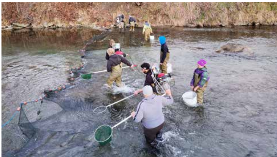
Monitoring im Unterlauf der Fuscher Ache.

Hinsichtlich der Beurteilung der Funktionalität der Aufstiegshilfe KW-Gries wurde unter anderem auch eine Elektrofischung an der Fuscher Ache durchgeführt. Genauer im Auslaufbereich des Kraftwerks II der Firma Hermann & Müller – ca. 400 Meter flussabwärts. Diese fischökologischen Untersuchungen wurden am 20.11.2022, durch das Technische Büro für Ökologie und Umweltschutz Petz OEG, ausgeführt. Die Errichtung von passierbaren Fischwanderhilfen, die den wandernden Fischen bei Kraftwerken sowohl den Auf- als auch den Abstieg ermöglichen, ist ein wichtiger Schritt in Richtung eines ökologisch vertretbaren Umgangs mit den Gewässern. Das Erreichen vom „guten ökologischen Zustand“ ist nach der im Dezember 2000 in Kraft getretenen EU-Wasserrahmenrichtlinie die Mindestanforderung für alle EU-Mitgliedstaaten.