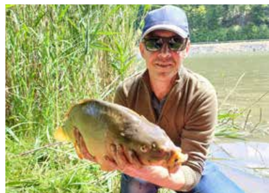
FV Wienerwald: Wenn die Karpfen wollen – dann richtig.

Mittlerweile sind die ersten Lieferungen