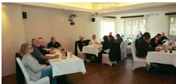
Einstimmige Wahl des Vorstands bei der Generalversammlung des FV Schillerwasser Ende September.