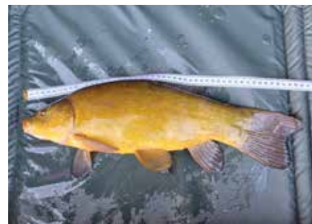
FV Floridsdorf: Erinnerungsfoto der gefangenen Schleie – fischschonend auf Abhakmatte.

Wir können auch die Kombinationslizenzen für die Neue Donau (Floridsdorf/Donaustadt I; Floridsdorf/Donaustadt II; Floridsdorf/Freudenau linkes Ufer) sowie die Donau-Generallizenz ausstellen. Wir freuen uns auf viele alte und neue Gesichter!