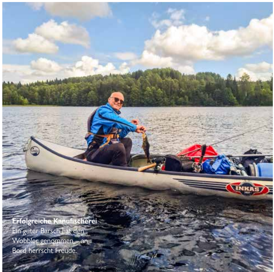
Erfolgreiche Kanufischerei Ein guter Barsch hat den Wobbler genommen – an Bord herrscht Freude.