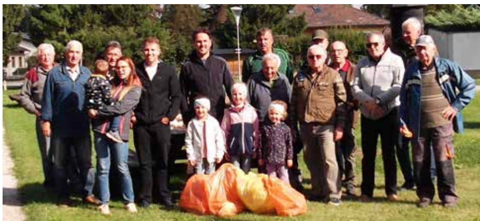
Die fleißigen Helfer des FV Schönau/Orth bei der Uferreinigung der Donau.

Am Samstag, dem 27. September 2025, lud der Fischereiverein Schwechat 71 Kinder