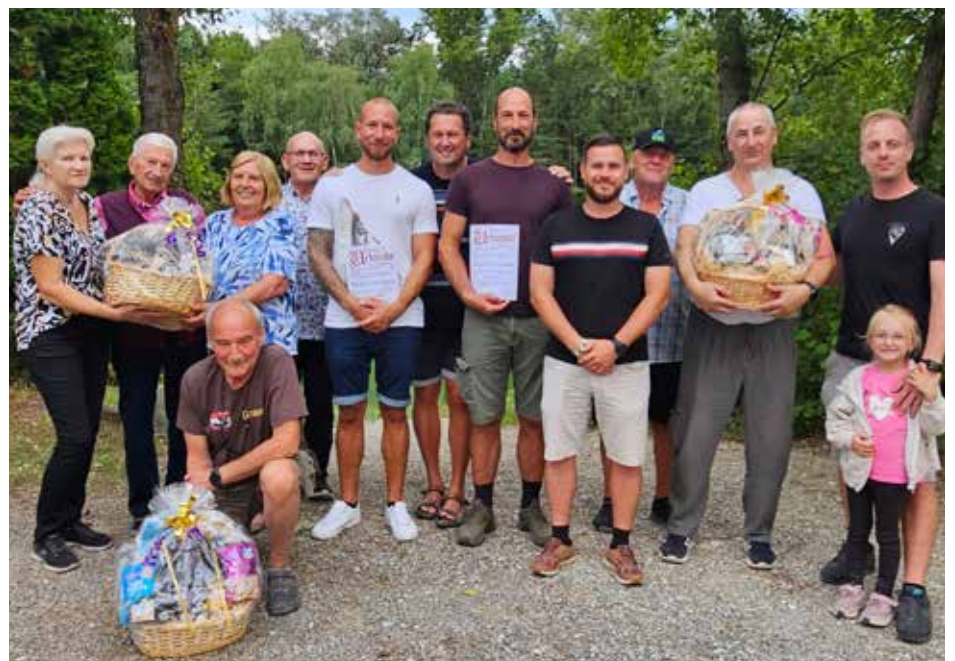
Sommer-Teichfest am Drei-Birken-Teich: Ehrungen in festlichem Rahmen.

Sonntag, 9. November 2025, um 9 Uhr: Jahreshauptversammlung des FV Drei-Birken-Teich im Restaurant „Seinerzeit“.