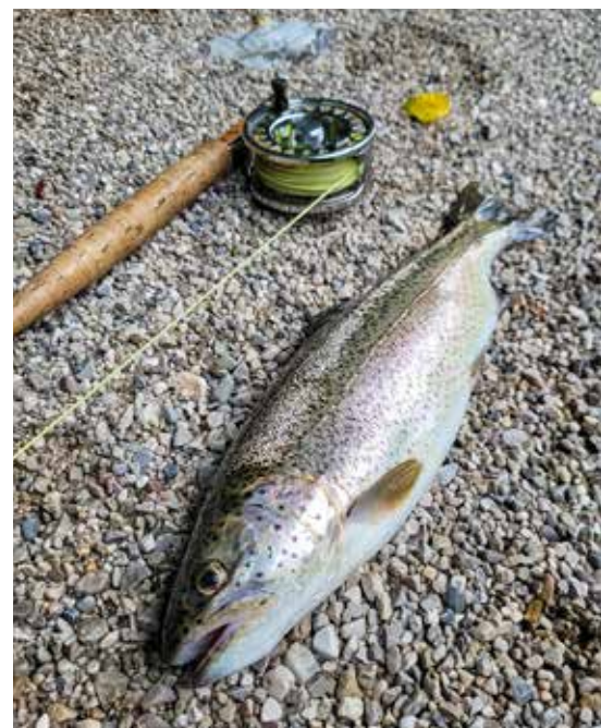
Regenbogenforellen eignen sich perfekt.