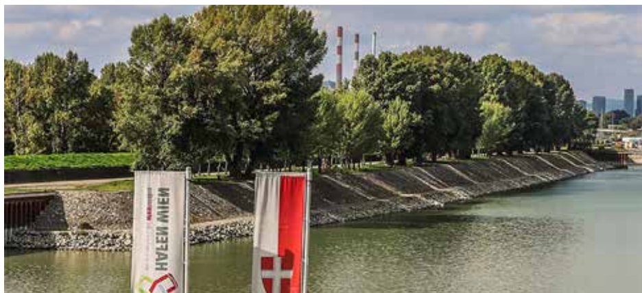
„Parkähnliches Ambiente“: Der Revierbereich im Freudenauer Hafen nach dem Grünschnitt.

stehen, wäre es von Vorteil, wenn Ihr die Jahres-Fangstatistiken schon vorab ausfüllt und unterschreibt. Denkt daran, Euer Mitgliedsbuch, die für 2026 gültige amtliche Fischerkarte des jeweiligen Bundeslandes, die alte Lizenz und Fangstatistiken aus 2025 und genügend Bargeld mitzubringen. Neumitglieder: Bitte für das Mitgliedsbuch auch ein Passbild mitnehmen!