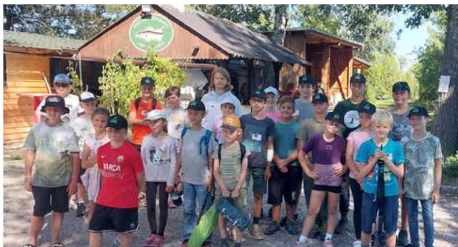
FV Oeynhausener: Jugendfischen am 21. September.

Am 21.09.2025 fand unser 2. Jugendfischen statt. Wir konnten dazu 24 Kinder begrüßen, und nach einer kurzen Anleitung konnten sie ihr Können am Wasser unter Beweis stellen. Es wurden schöne Fänge gelandet, die Kids hatten viel Freude und wollten nicht aufhören, zu fischen. Nach Beendigung der Veranstaltung konn-