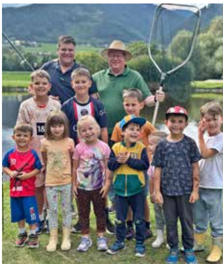
AFV St. Michael: Jugendlehr-Fischen am Chromwerkteich.

Wir führten heuer wieder vier Jugendlehr-Fischen durch, die wir mit viel Freude und lustigen lehrreichen Stunden mit vielen Kindern (insgesamt ca. 100) erleben durften.