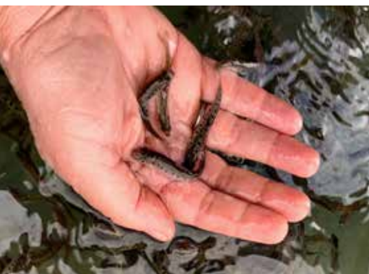
FV Salzburg: 1-sömmrige Äschen für die Salzach.

Erfrischende Getränke sorgten für die perfekte Begleitung zum reichhaltigen Ange-