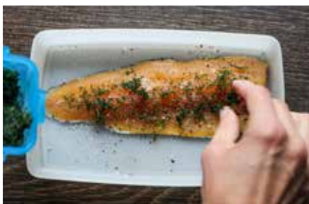
Einbeizen mit Salz, Zucker, Pfeffer und Dille.