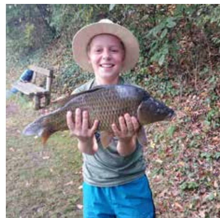
Erfolgsereignis: Ein schöner Fang beim Jugendfischen Breitenreicher.