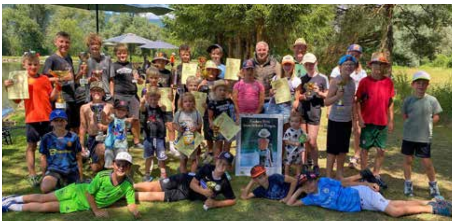
Ferienveranstaltung für Kinder und Jugendliche – ausgerichtet durch den AFV St. Michael.