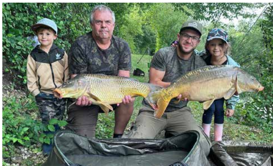
Ein wunderschöner Doppelfang beim Kinderfischen des FV Amstetten – unter Mithilfe der Betreuer.

Insgesamt lässt sich zusammenfassend sagen, dass das Jugendfischen wieder ein voller Erfolg war, da man den Kindern die Freude an der Fischerei und den respektvollen Umgang mit den Fischen und der