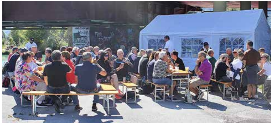
Gelungenes Fischerfest des FV Salzburg.

bot und luden zum Verweilen in geselliger Runde ein. Darüber hinaus wurden interessante Gespräche über das Fischen geführt und für die jüngsten Besucher eine kindgerechte Einführung ins Angeln angeboten – ein besonderes Highlight für viele Familien.