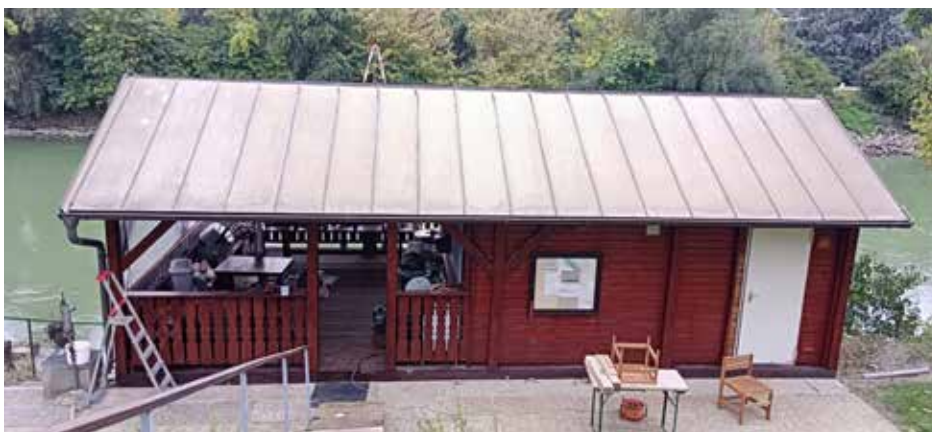
Die Freudenauer Vereinshütte erfuhr einen neuen Anstrich.

Wir ersuchen Euch, sämtliche Unterlagen bereitzuhalten. Damit alles etwas schneller geht und keine unnötigen Wartezeiten ent-