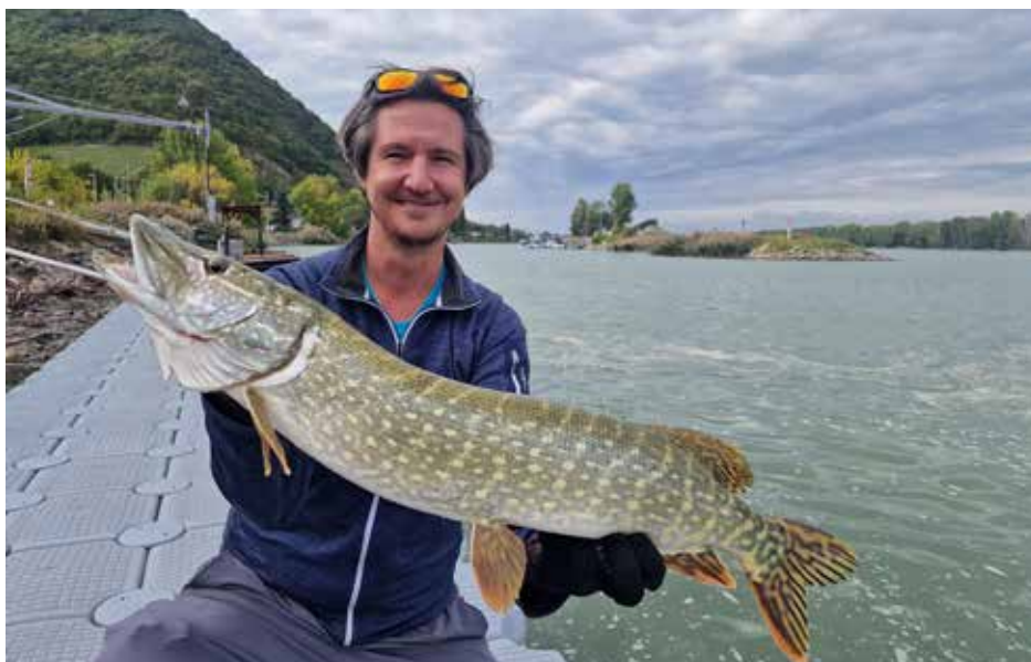
Ein wunderschöner Hecht, gefangen im Kuchelauer Hafen. Wir gratulieren unserem „tollen Hecht“!

Wir bitten euch einmal mehr, aus Rücksicht gegenüber den anderen FischerkollegInnen vor dem Jahresende die Angelplätze sauber zu hinterlassen. Wir wünschen allen Fischer:innen einen ruhigen Jahresausklang und eine besinnliche Weihnachtszeit sowie einen erfolgreichen Start ins neue Jahr!