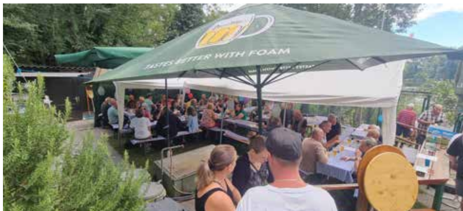
Wieder gut besucht war das heurige Sommerfest des FV Schillerwasser.