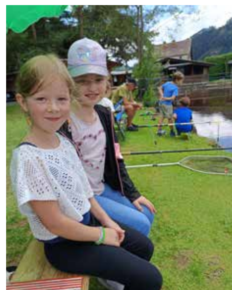
Gemeinsames Warten auf den ersehnten Biss beim Kinderfischen des AFV St. Michael.

Dazu gab es ein auch ein Freundschaftsfischen mit den Fischerkollegen vom AFV Knittelfeld. Das Wetter war uns an diesem