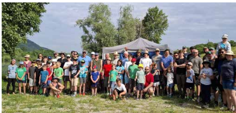
Die vielen Teilnehmer:innen, Eltern und Betreuer beim Kinderfischen des FV Floridsdorf.

In diesem Jahr veranstalteten wir im Juni ein Stippfischen/Friedfischangeln für interessierte Jungangler und Junganglerinnen. Wir konnten über 25 Kindern die Fischerei näherbringen. Obwohl aufgrund des Hochwassers im vorigen September die Bedienungen nicht einfach waren, konnten diverse Fische (Rotaugen, Rotfedern, Flussbarsche, Sonnenbarsche,