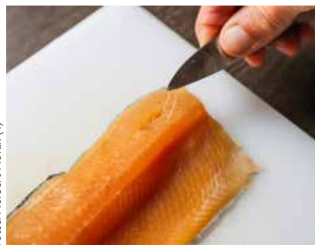
Herauszipfen der Rückengräten.