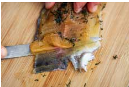
Herausschneiden mundgerechter Stückchen.