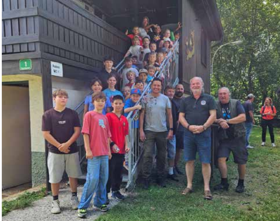
FV Muckendorf: Über zwanzig Teilnehmer:innen waren im August beim Muckendorfer Kinderfischen mit dabei.

14.2.2026, 10 bis 13 Uhr: Einzahlung, Gasthaus zur Bast; 16.2.2026, 18 Uhr: Sitzung, Gasthaus „Zur Bast“.