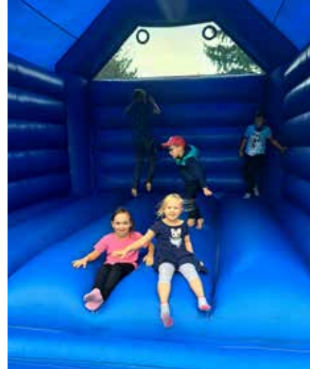
Als Ausgleich gab es beim Amstettener Kinderfischen sogar eine Hüpfburg.

Am 23. August 2025 veranstalteten wir das alljährliche Jugendfischen des Vereins.