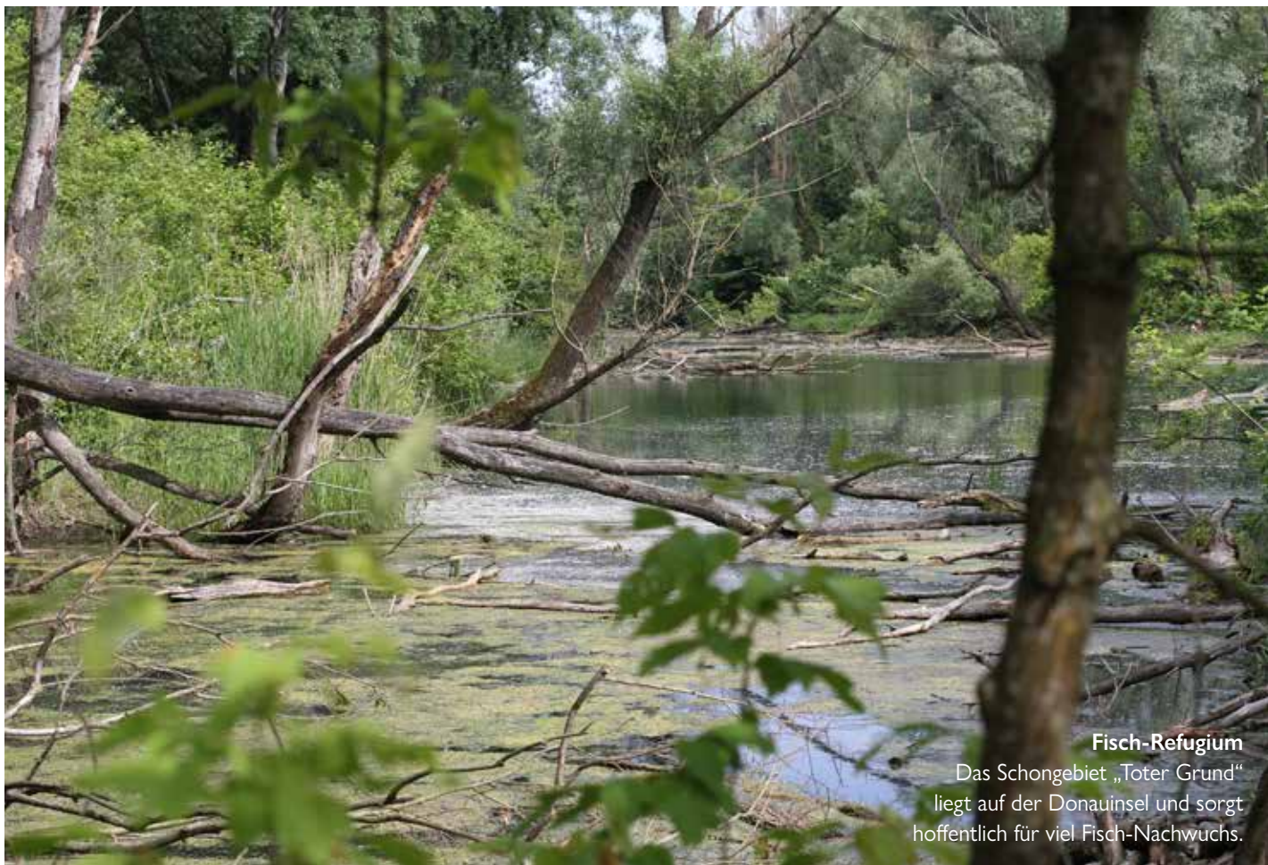
Fisch-Refugium Das Schongebiet „Toter Grund“ liegt auf der Donauinsel und sorgt hoffentlich für viel Fisch-Nachwuchs.