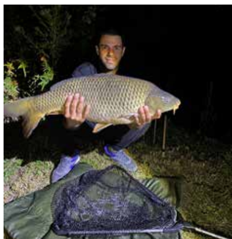
Mit Geduld und Ausdauer fängt man an der Schwechat auch in den Nachtstunden.

Zum Abschluss erhielten die Kinder nicht nur eine Urkunde und ein liebevoll zusammengestelltes Goodie-Bag, sondern auch eine glänzende Medaille als Erinnerung an das schöne Angelerlebnis.